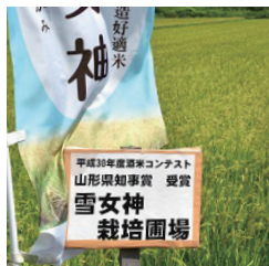
酒米コンテスト最優秀賞の圃場