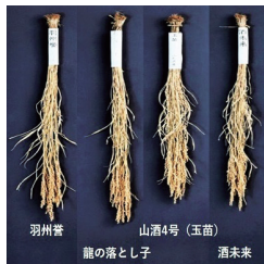
地酒を醸す多彩な品種群