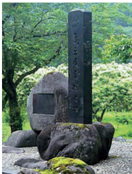
「亀の尾発祥の地」石碑(庄内町立谷沢)

造った吟醸酒は素晴らしかった」。ある老杜氏の一言をきっかけに昭和56年、新潟県の蔵元で亀の尾による酒造りが復活した。わずかな種もみを元にした米づくりから始まった酒造米としての亀の尾の復活は、漫画家尾瀬あきら氏のコミック「夏子の酒」のモデルになり、全国の蔵元や日本酒ファンにその存在感を再び知らしめることになる。