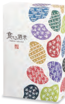
贈答用化粧箱2個入り