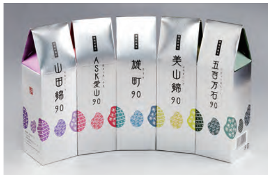
(左から)山田錦/ASK 愛山/雄町/美山錦/五百万石 各2合(300g)入り 756~950円(税込)