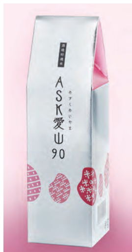
2合(300g)入り 950円(税込) 原材料：米(兵庫県産)

上品で優しい風味が特徴です。和食などの素材の味を生かすデリケートな料理と相性の良いお米です。