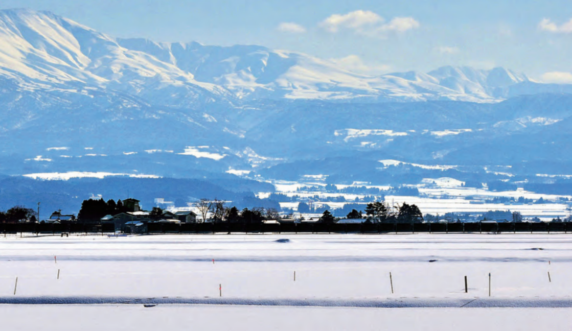
新雪の月山と庄内平野(庄内町余目)