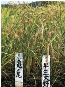
山形県奨励品種第1号(1914)「亀の尾」