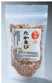
たかきび 100g 270円(税込み)