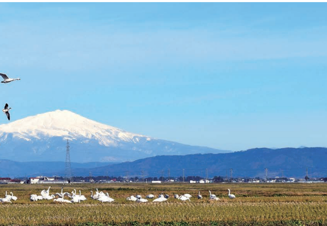
白鳥舞う初冬の庄内平野