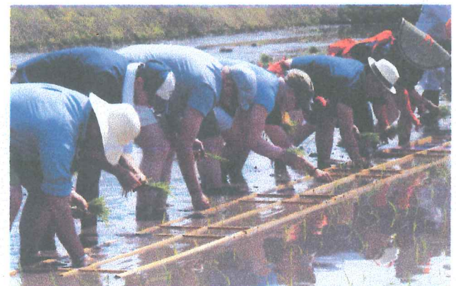
～山田錦の「テロワール」～IWC田植えイベントの様子