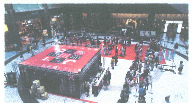
平成27年9月21・22日開催(大阪初開催！) 兵庫県産山田錦プレミアム日本酒BAR2015の様子